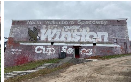
v.l.n.r. Cooper Barrel Distillerie, NASCAR Hall of Fame, North Wilkesboro Speedway

Die Autorennen und NASCAR haben ihre Wurzeln bei den „Moonshinern“, den Produzenten von illegalem Alkohol in North Carolina während der Prohibition in den USA, und den „Bootleggern“, den Händlern des damals illegalen Getränks, die den Alkohol zur Tarnung in ihren Stiefeln versteckten. Um nicht vom Gesetz erwischt zu werden, bauten Moonshiner und Bootlegger für den Transport des unerlaubten Getränks immer schnellere Autos. Was in den 1930er Jahren mit gelegentlichen Autorennen anfang, hat sich heute zu einer Multimilliarden-Dollar Industrie entwickelt, die Motorsportbegeisterte aus der ganzen Welt zusammenbringt.