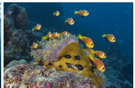
SENTIDO OBLU Helengeli