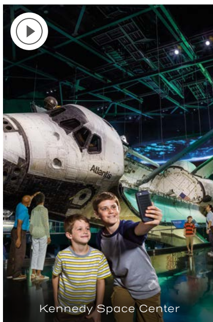
Kennedy Space Center