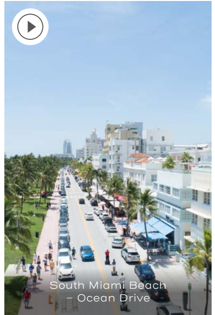
South Miami Beach - Ocean Drive