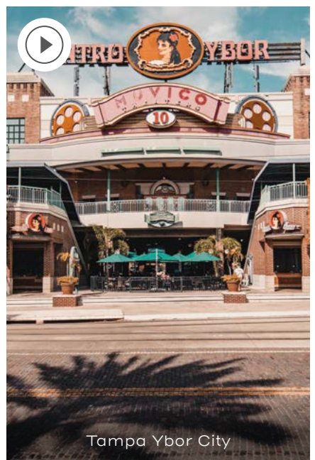
Tampa Ybor City