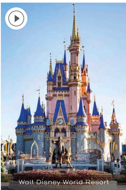
Walt Disney World Resort