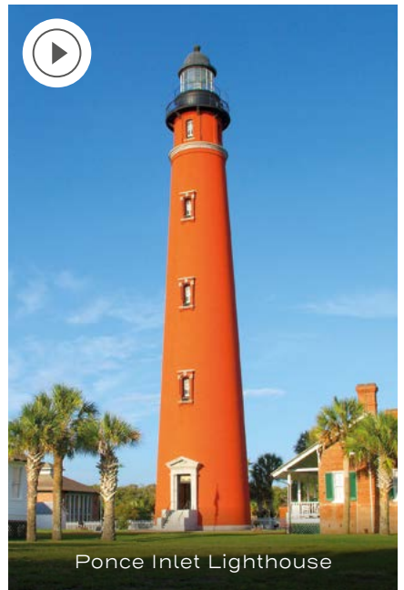
Ponce Inlet Lighthouse