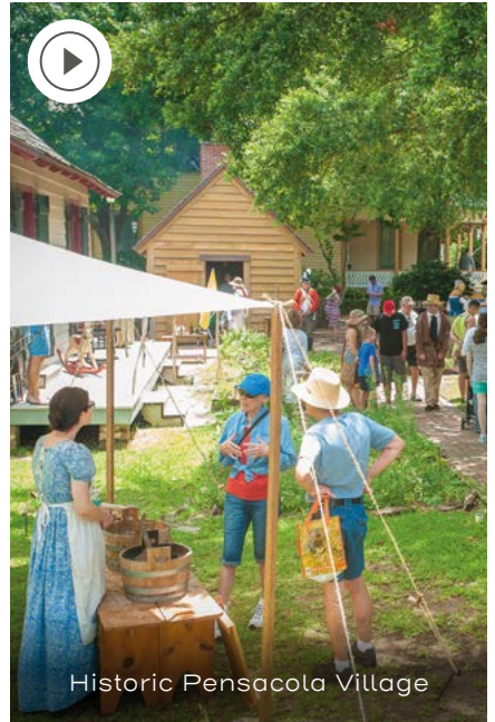
Historic Pensacola Village