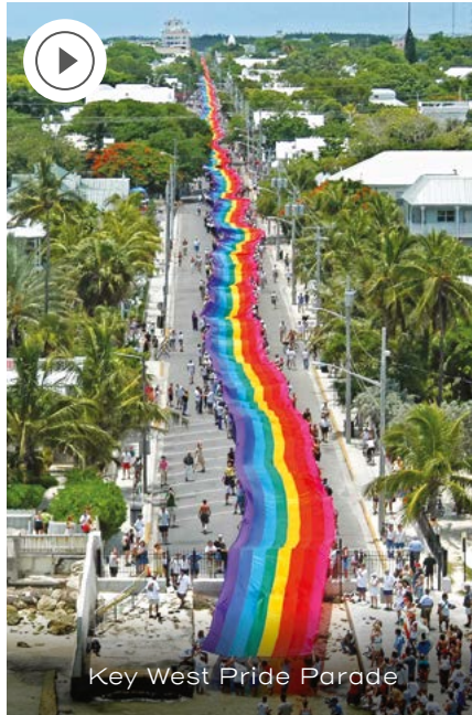
Key West Pride Parade