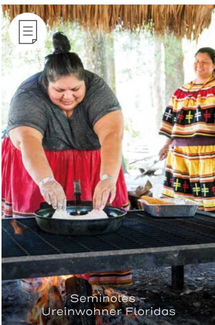
Seminoles – Ureinwohner Floridas