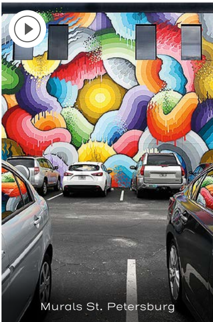
Murals St. Petersburg