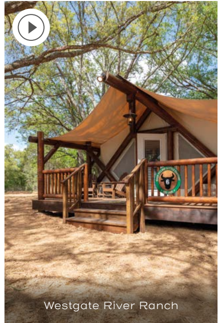
Westgate River Ranch