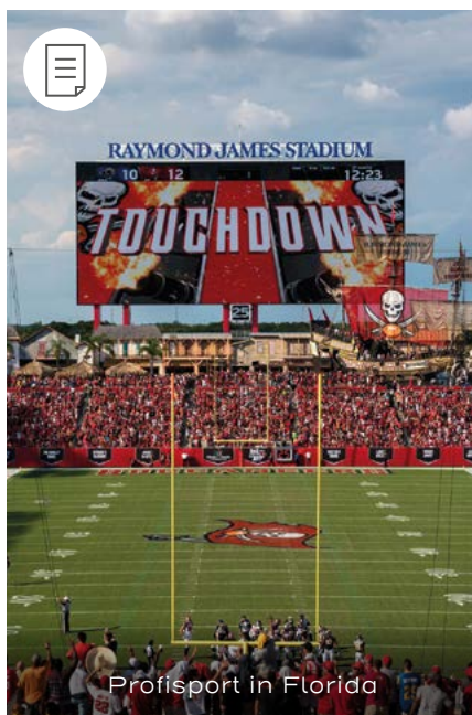
Profisport in Florida