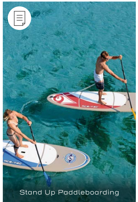
Stand Up Paddleboarding