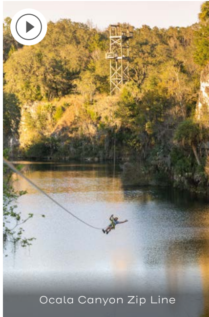
Ocala Canyon Zip Line