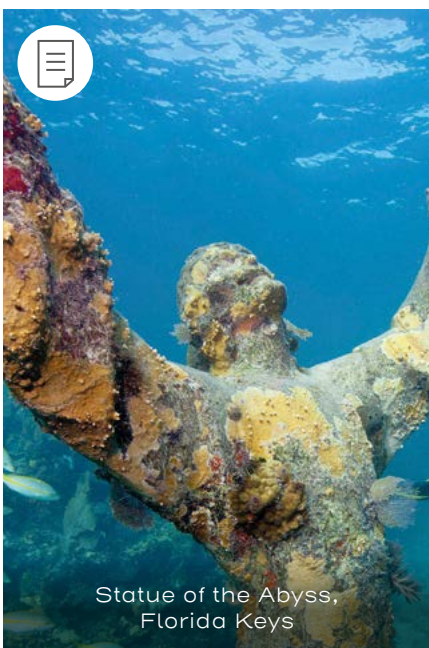
Statue of the Abyss, Florida Keys