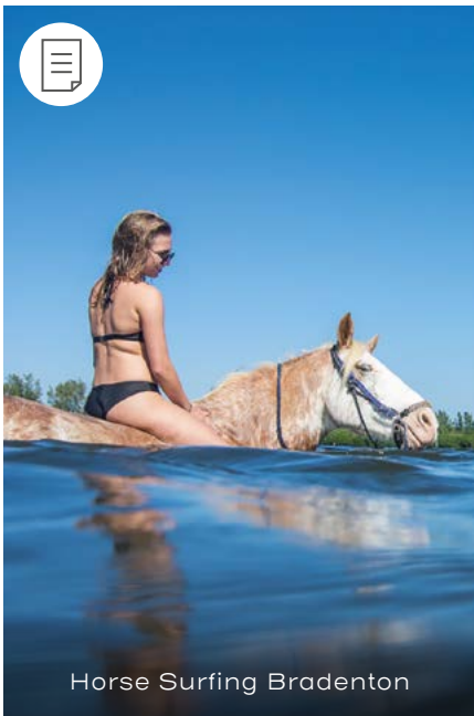
Horse Surfing Bradenton