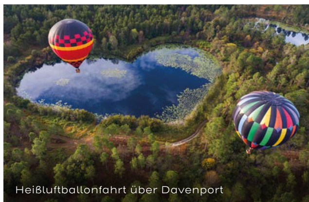
Heißluftballonfahrt über Davenport

SO VIELE MÖGLICHKEITEN DER ENTSPANNUNG ES IN FLORIDA GIBT, SO VIELSEITIG IST AUCH DAS SPORTLICHE UND AUFREGENDE AKTIVITÄTENANGEBOT.