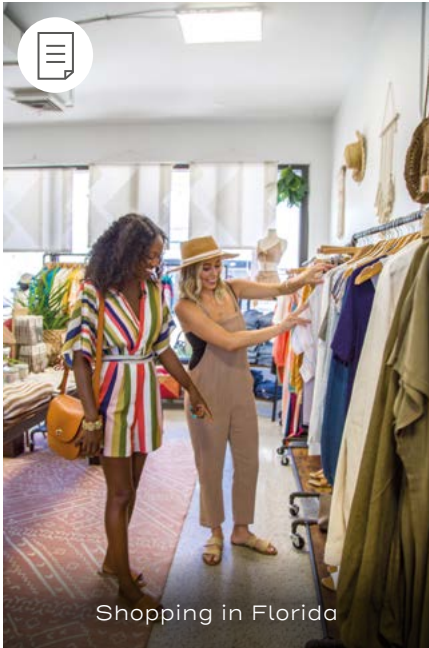
Shopping in Florida