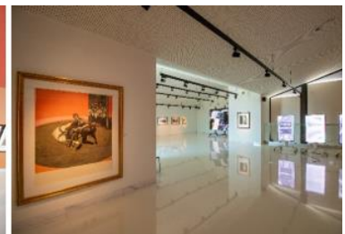
© HILODI – World of Wine