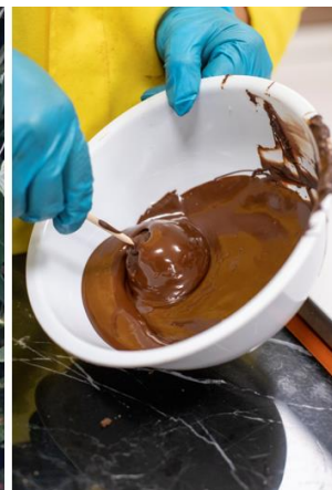
© HILODI – World of Wine